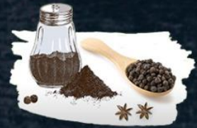
Krishna Marich 1 parts