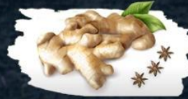
Sunthi 2 parts