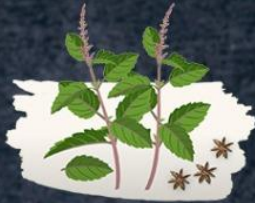
Tulsi Leaves 4 parts

Formulation comprises of 4 medicinal herbs