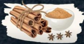
Dalchini 2 parts